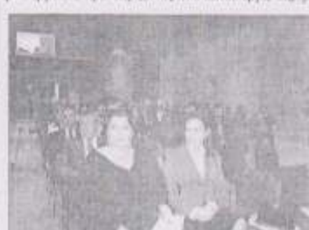
Μέρες και συνεργασίες που μπορούν να ασφαλιστούν τους πολίτες και των δύο χωρών.

Συνεχιστικά που αναμένεται πρώην η Γενική Γραμματεία της Περιφέρειας ΑΜ-Θ κ. Κώστα, όπως ότι η διασυνοριακή και διαπεριφερειακή συνεργασία αποτελεί πλέον ένα αναγνωρισμένο συστατικό εργαλείο, επιδόσεις αποτελέσματα για την πρόοδο και την εξασφάλιση περιοχών όπως η Ανατολική Μακεδονία και Θράκη, ενώ σε διάστημα